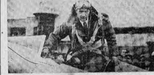
El aviador millonario Howard Hughes, quien hizo el vuelo Nueva York-Paris en la mitad del tiempo que invirtió el coronel Charles A. Lindbergh, y quien batiendo un nuevo record llegó ayer a Moscú y Omsk.

LONDRES, 12 UP.—Informes de prensa recibidos en esta capital con procedencia de Madrid afirman que el número de muertos causados por los dos ataques aéreos contra esa base naval subió a cuarenta y cinco, ciento cincuenta y dos personas fueron heridas, y un total de cuarenta y edificios destruidos.